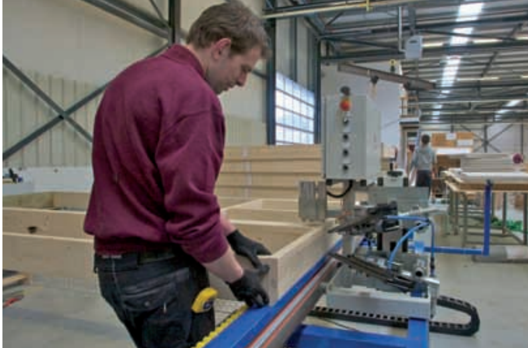
In de fabriek (Brabant Prefab Oss). Prefab = kwaliteit, ...